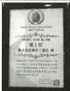
アステックペイント社の表彰状

防水、遮熱塗料で有名なアステックペイント社の2017、2018年のコンペでは、奈良県1位を受賞。 塗装工事の見積もりを一般の方に理解してもらうため価格以外にも説明の必要性を痛感。塗装工事で失敗しないための小冊子を素人でも分かる外壁診断書を10年前から作成して悪質業者撲滅を目指す。